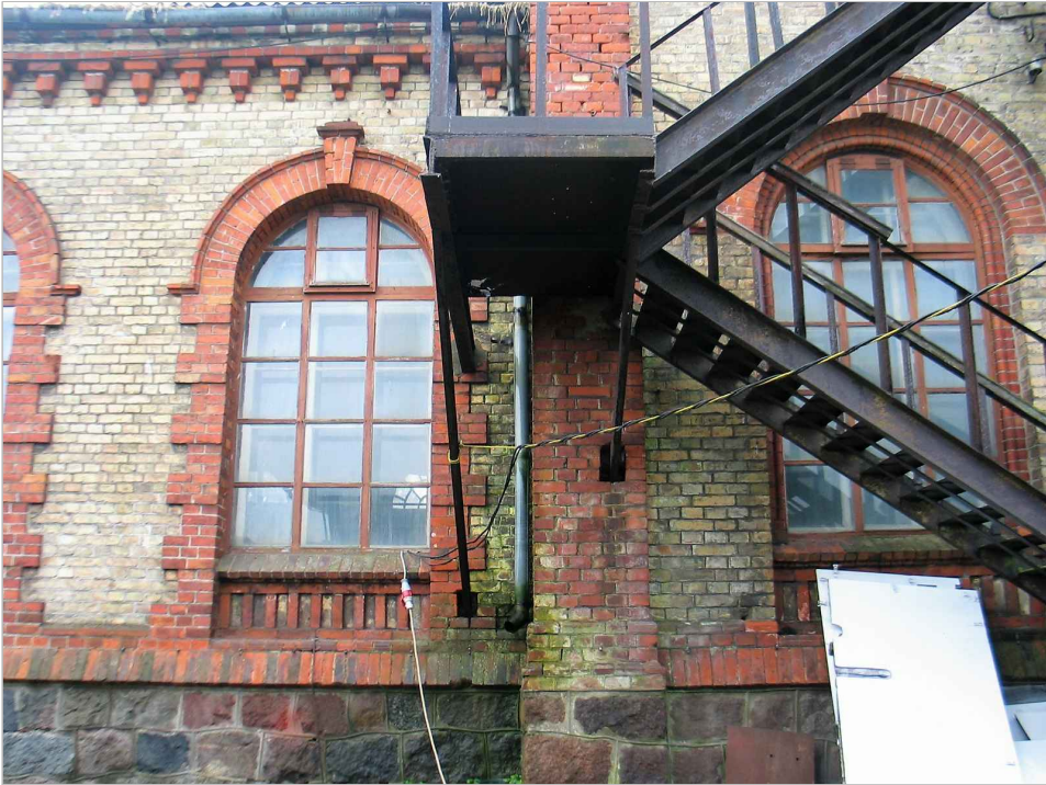
att. 49. Kāpņu piebūve skatā no Ventas.