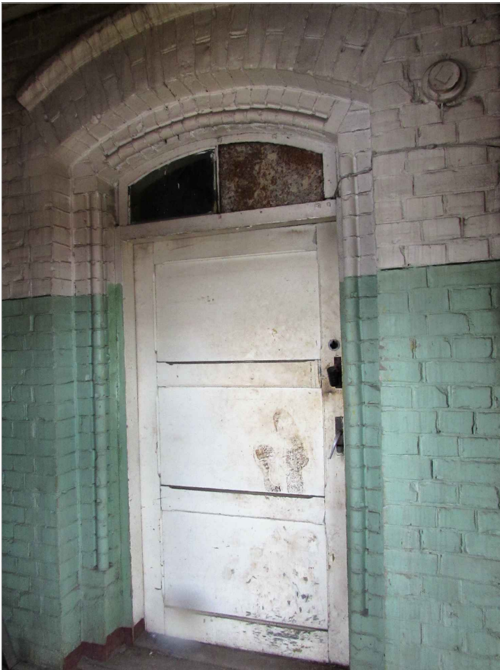
att. 52. Durvis 2. st. piebūvē bij. loga aillas vietā.