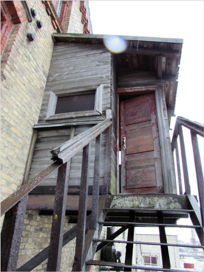
att. 51. Slēgtā izbūve vurs kāpnēm.