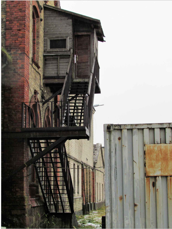
att. 50. Kāpņu kopskats.